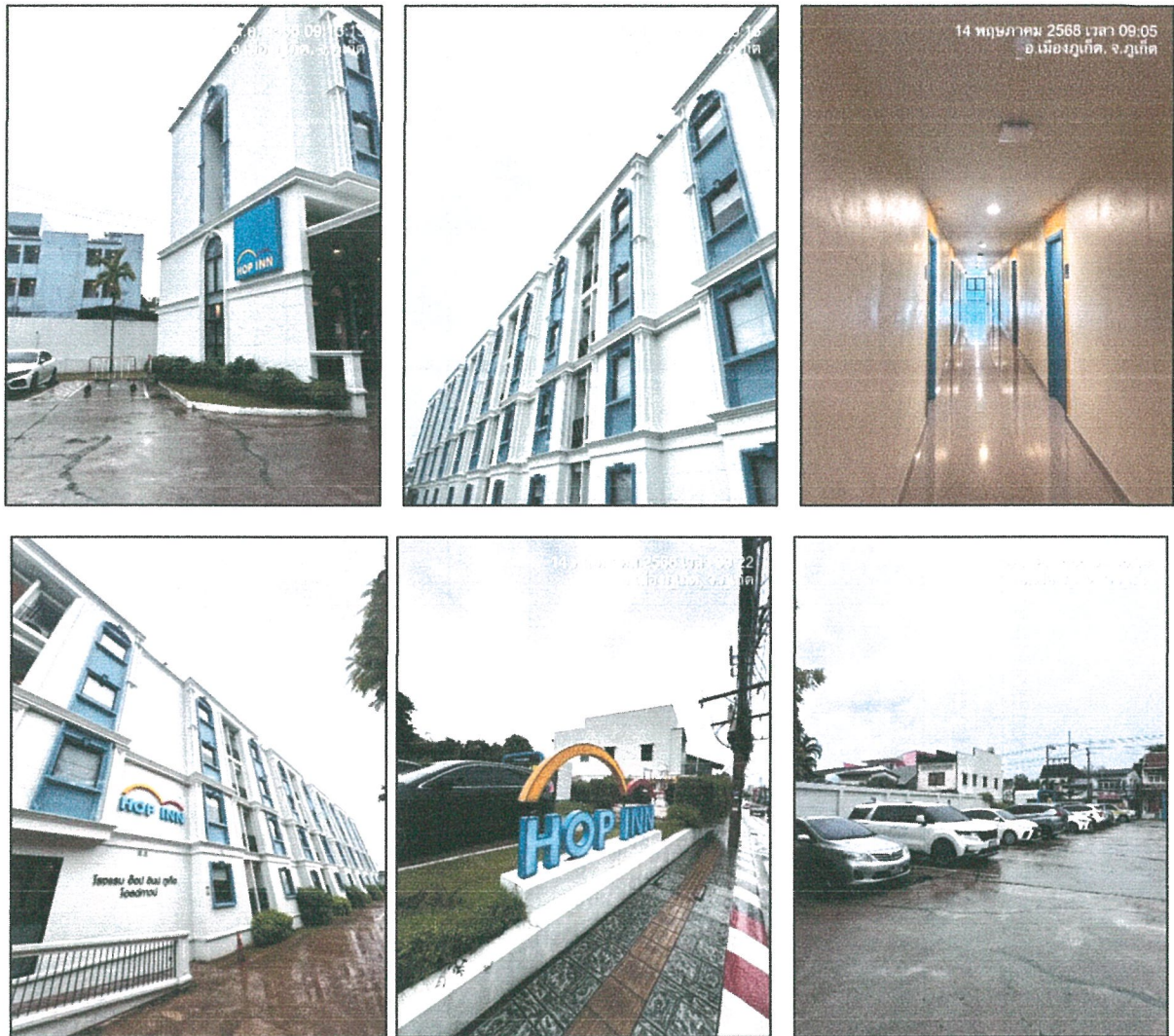
รูปภาพที่ 1.4 การใช้พื้นที่ของโครงการ